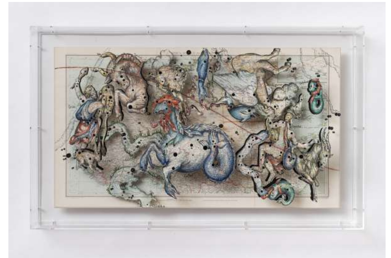
Constellation 17 (North Africa), 2019 Aquarelle et découpes sur papier marouflé sur toile 59,8 x 98,4 cm