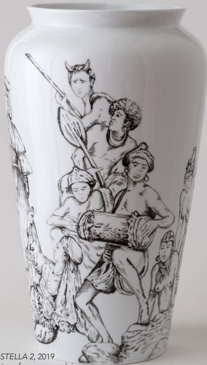
UNDUETRE...STELLA 2, 2019 Peinture troisième feu sur porcelaine 47 cm de hauteur