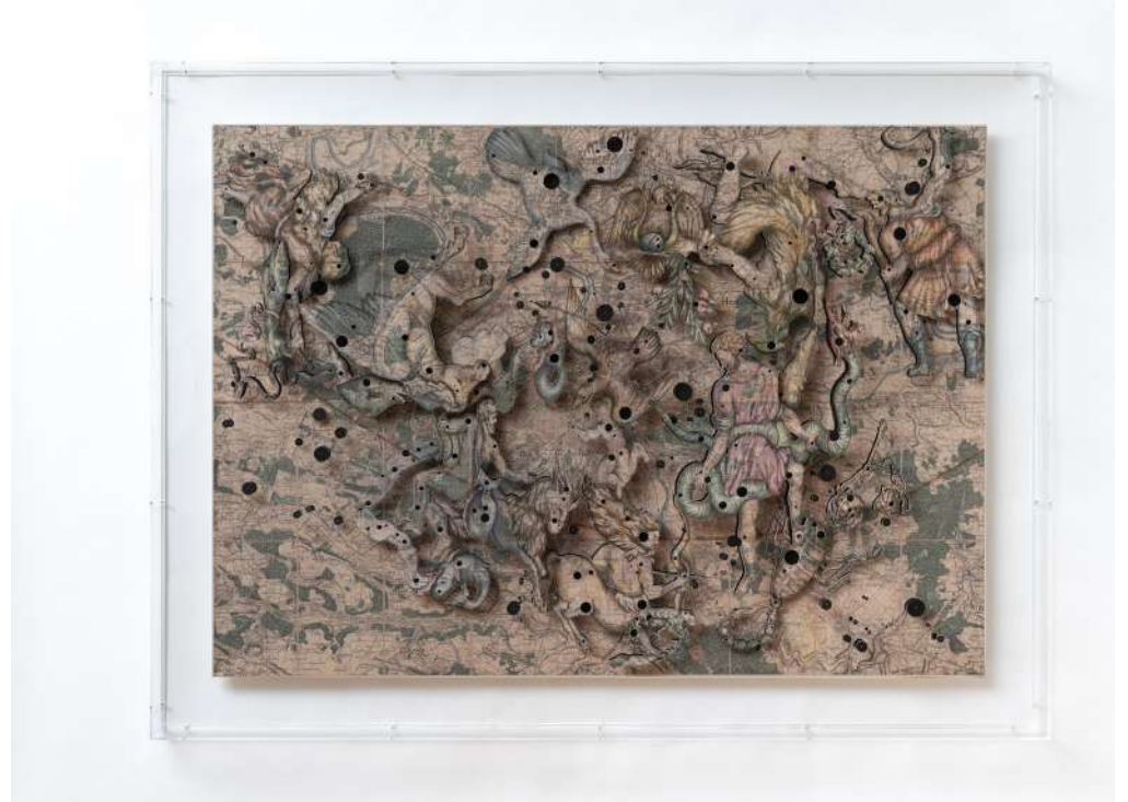
Constellation 13 (Paris, 1860), 2019 Encre, gesso et découpes sur papier marouflé sur toile 127 x 168,8 cm