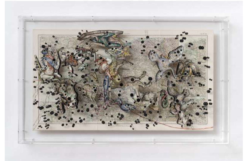
Constellation 16 (France), 2019 Aquarelle et découpes sur papier marouflé sur toile 59,8 x 98,4 cm