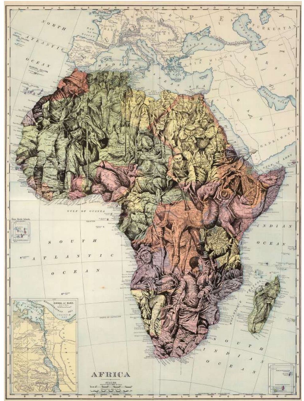
Migration Africa, 2018 Encre sur papier marouflé sur toile 221,5 x 170 cm