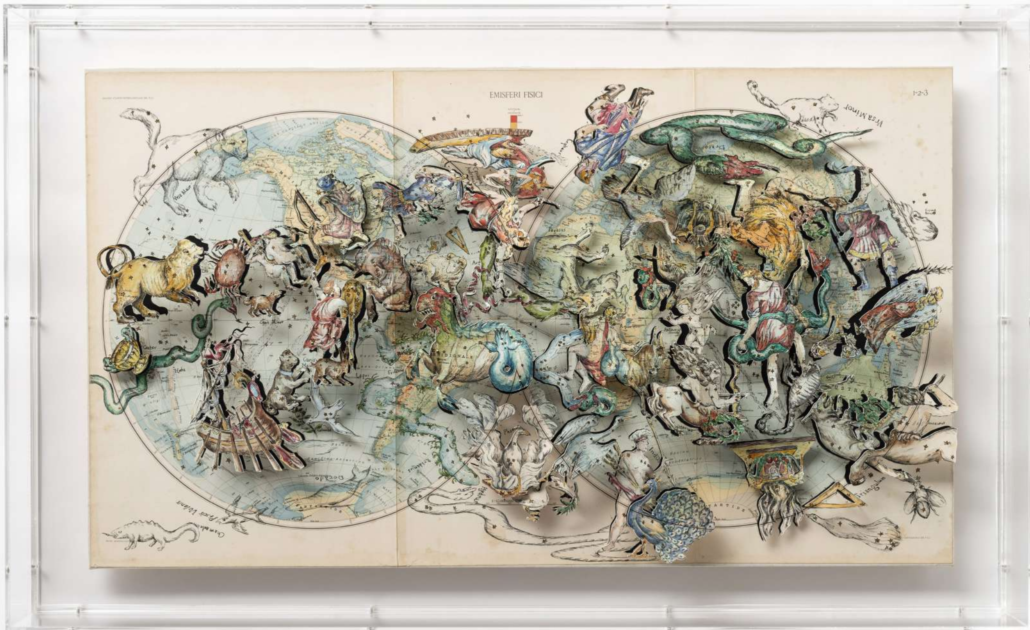
Constellation 4, 2019 Aquarelle et découpes sur papier maroufflé sur toile 59,8 x 98,4 cm