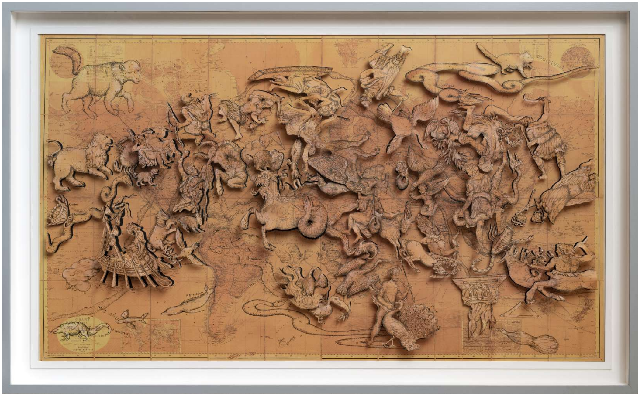
Constellation 1, 2018 Aquarelle et découpes sur papier marouffé sur toile 145 x 230 cm