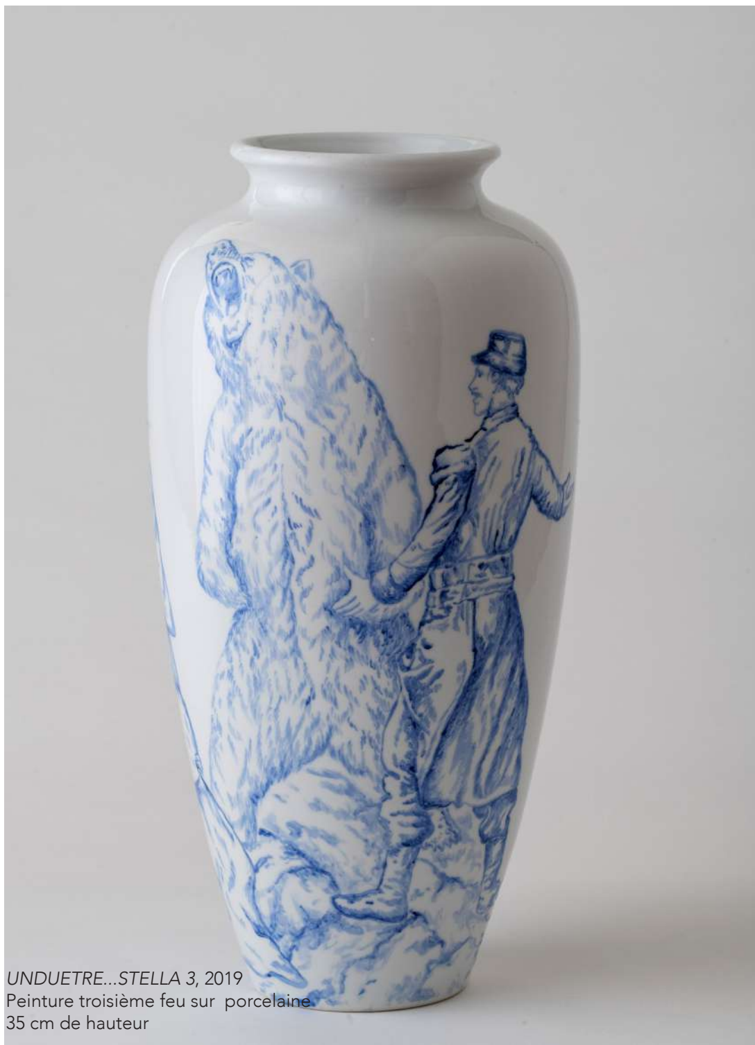
UNDUETRE...STELLA 3, 2019 Peinture troisième feu sur porcelaine 35 cm de hauteur