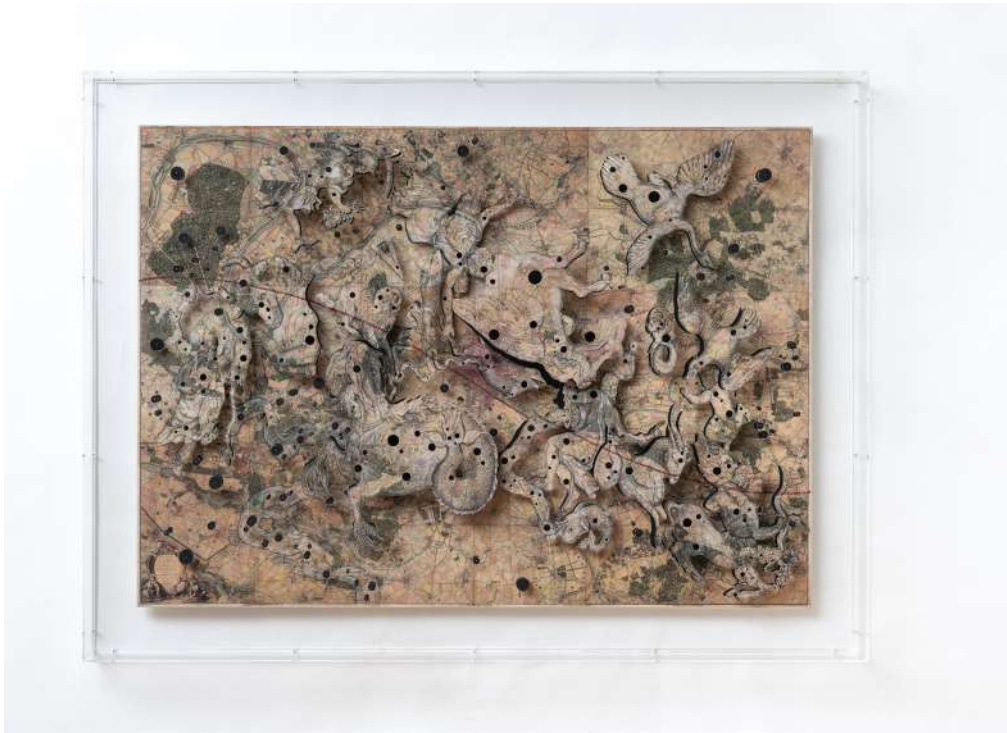
Constellation 12 (Paris, 1740), 2019 Encre, gesso et découpes sur papier marouflé sur toile 127 x 168,8 cm