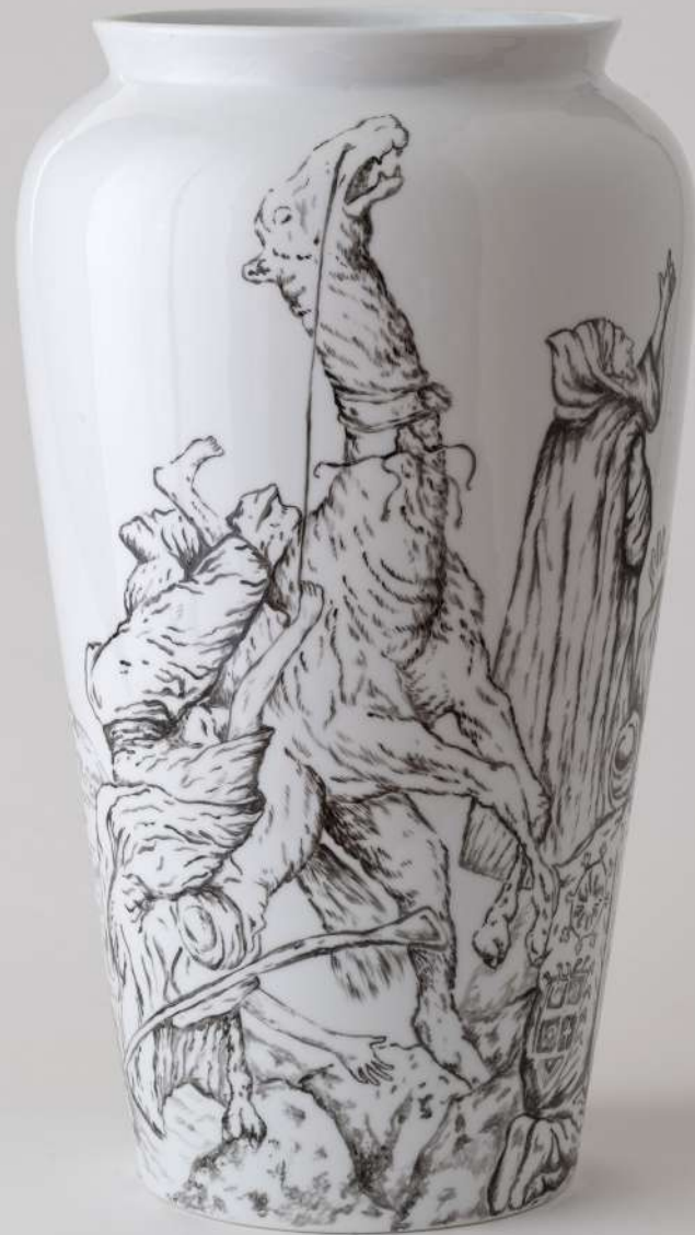
UNDUETRE...STELLA 1, 2019 Peinture troisième feu sur porcelaine 47 cm de hauteur