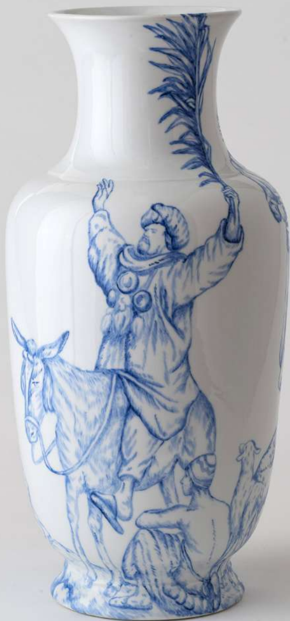
UNDUETRE...STELLA 4, 2019 Peinture troisième feu sur porcelaine 41 cm de hauteur