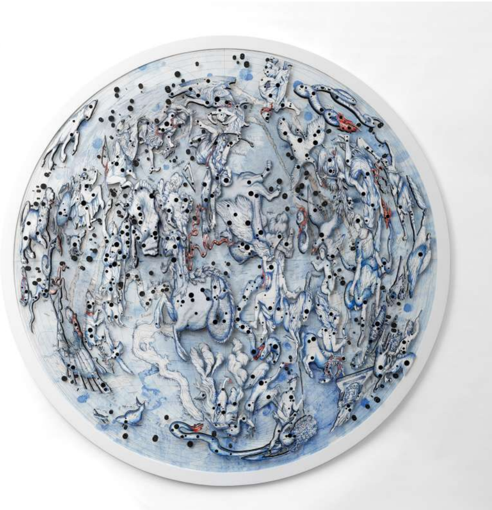
Constellation 10, 2019 Encre, acrylique et découpes sur papier marouflé sur toile 200 cm de diamètre