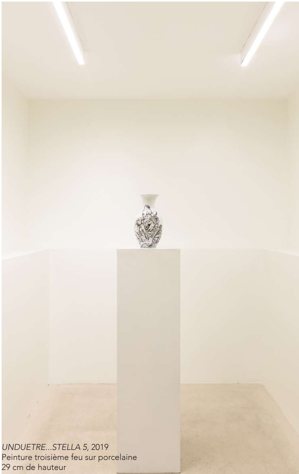
UNDUETRE...STELLA 5, 2019 Peinture troisième feu sur porcelaine 29 cm de hauteur