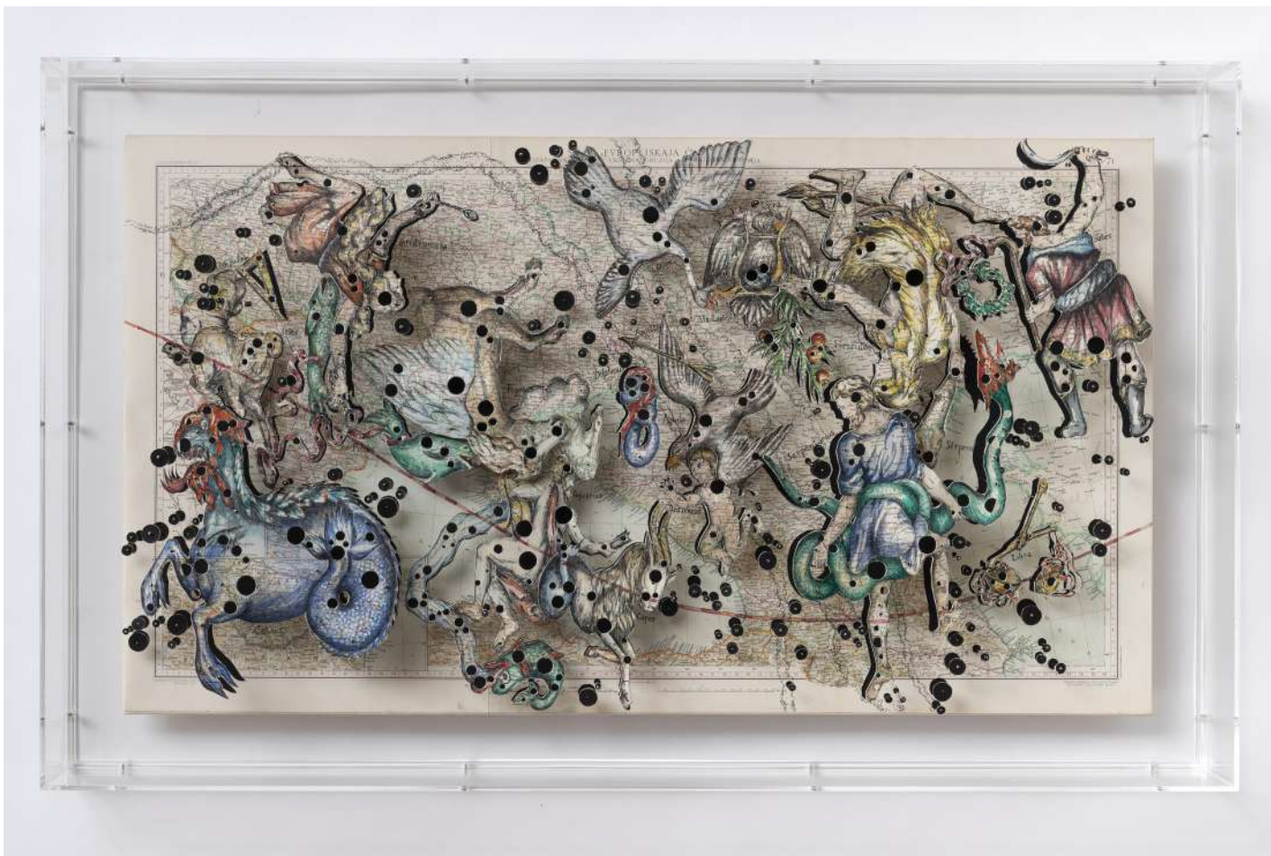
Constellation 15 (URSS) , 2019 Aquarelle et découpes sur papier marouflé sur toile 59,8 x 98,4 cm

« Dans les grands tableaux de Constellations , j'ai superposé deux cartes. Le fond est une carte terrestre. Au fil des siècles, celle-ci est devenue de plus en plus précise, mais toujours plus sujette au changement, car liée aux découvertes, à la politique et aux changements sociétaux. S'y superpose une carte céleste mythologique peinte à l'aquarelle, issue des fresques du Palazzo Farnese à Caprarola, l'instrument d'une vision archaïque du monde qui n'a jamais changé au fil du temps. »