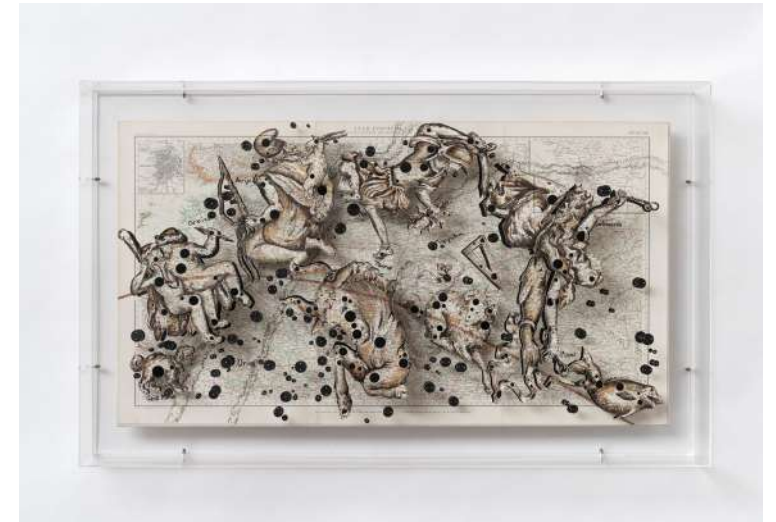
Constellation 14 (URSS), 2019 Aquarelle et découpes sur papier marouflé sur toile 59,8 x 98,4 cm